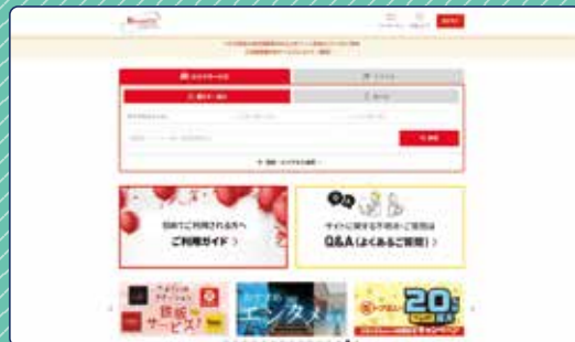
ベネフィット・ステーションHP