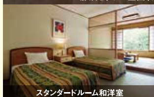
スタンダードルーム和洋室