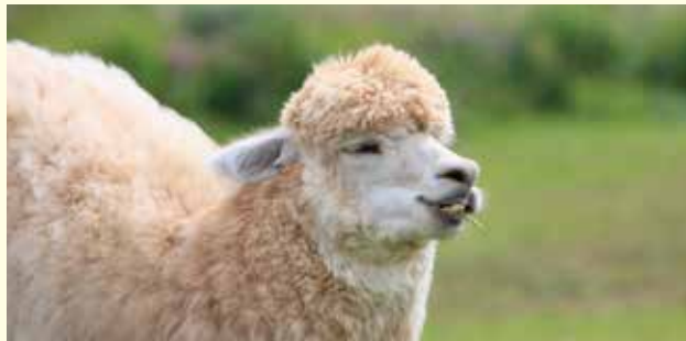
那須どうぶつ王国 (ホテルより車で約30分)