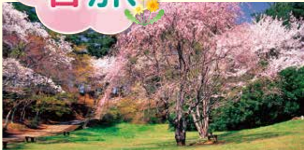
修善寺自然公園 (ホテルより車で約20分)

いつもの旅を もっとお得に、もっと楽しく! 会員様だけの満足がここに 있습니다。