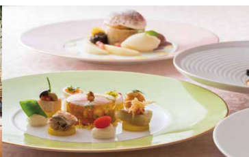
フランス料理「クイーン・アリス」