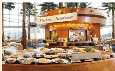
オールデイダイニング「カフェ トスカ」