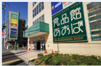
食品館あおば六角橋店 徒歩6分