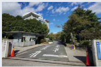
神奈川大学 徒歩6分