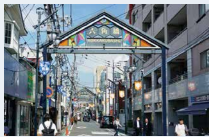
六角橋商店街 徒歩5分