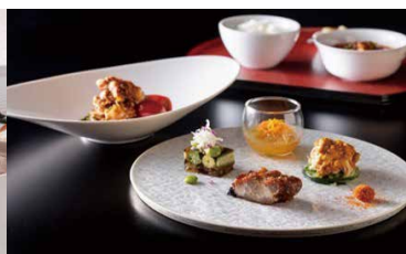
中国料理「スーツァンレストラン陳」