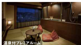
温泉付プレミアルーム

会員料金 2～5名様1室利用時/ 1名様あたり 大人 8,250円～ (一般料金例: 11,835円～)